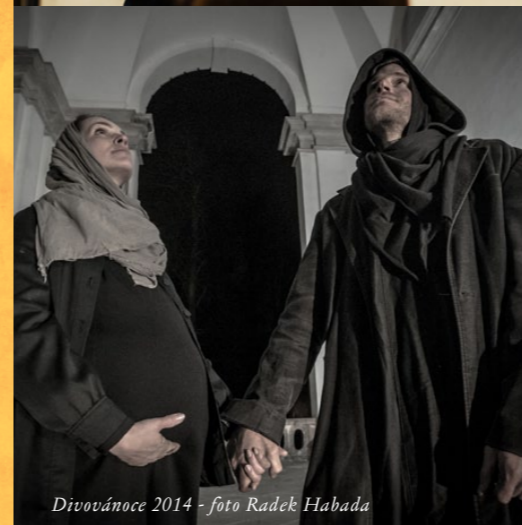
Divovánoce 2014