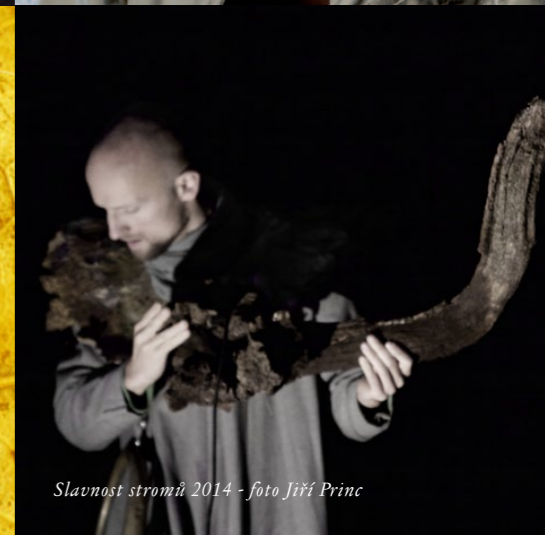
Slavnost stromů 2014