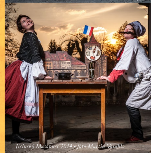
Jičínský Masopust 2014