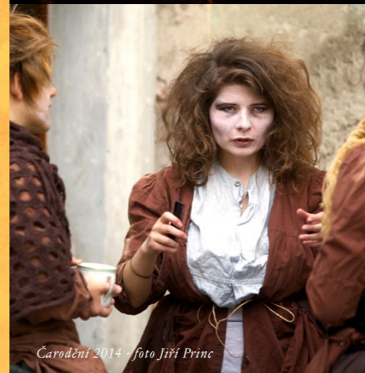
Čarodění 2014