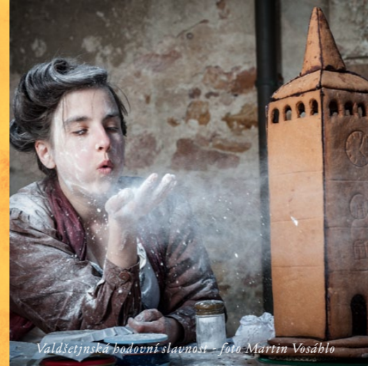
Valdštejnská hodovní slavnost