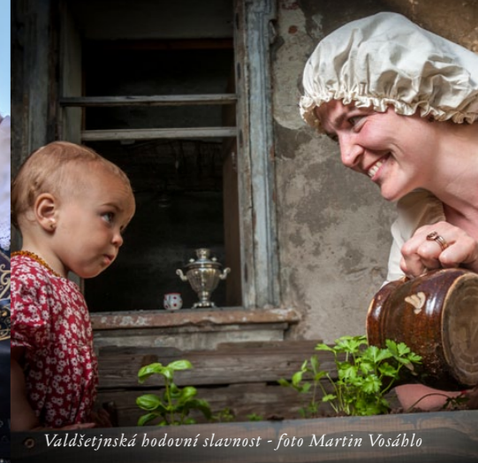
Valdštejnská hodovní slavnost