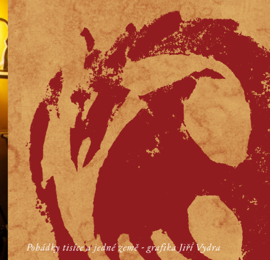
Pohádky tisíce a jedné země - grafika Jiří Vydra