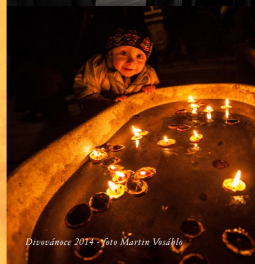
Divovánoce 2014