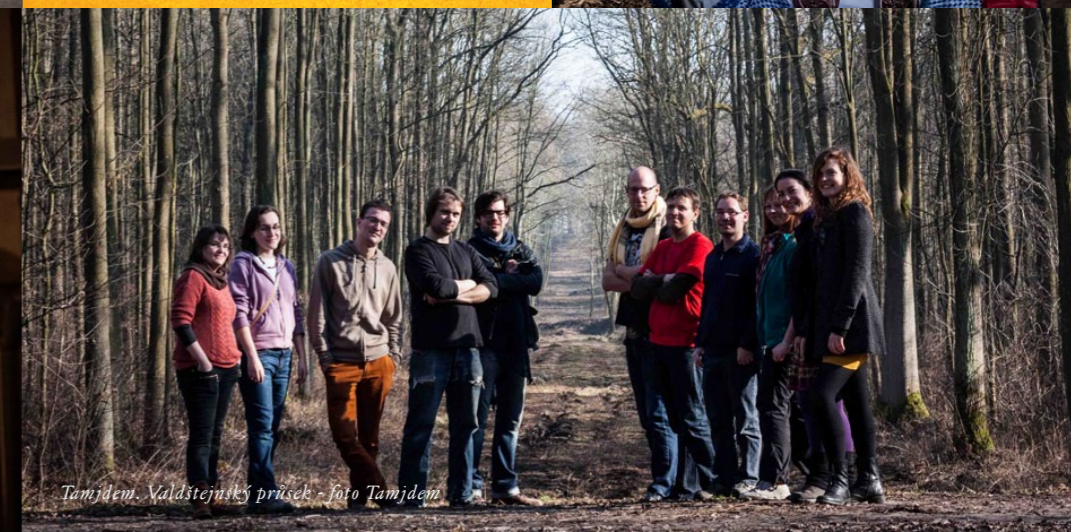
Tamjdem. Valdštejnský průsek