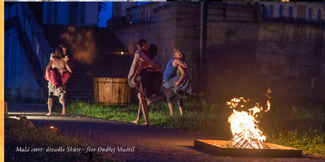
Malá smrt: divadlo Skutr