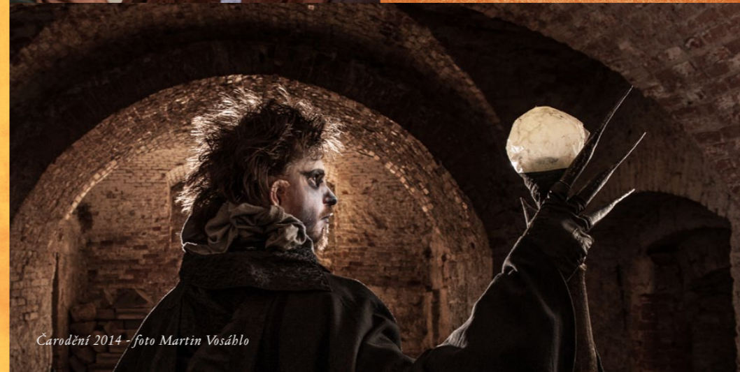
Čarodění 2014