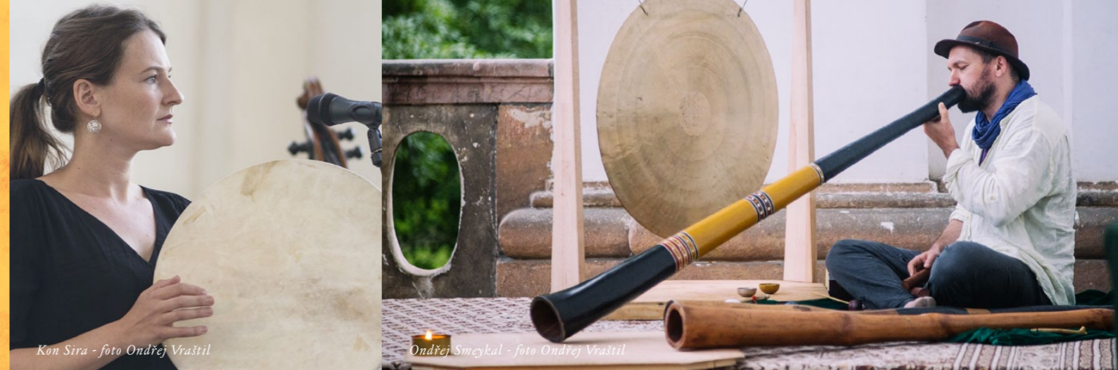
Kon Sira