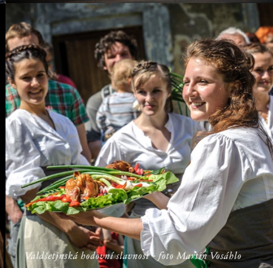
Valdštejnská hodovní slavnost