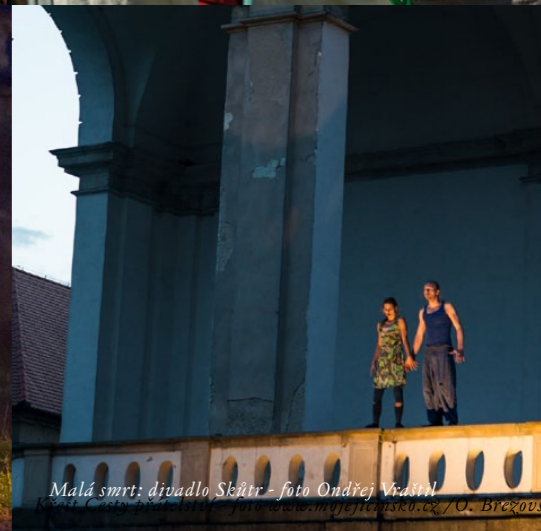
Malá smrt: divadlo Skutr