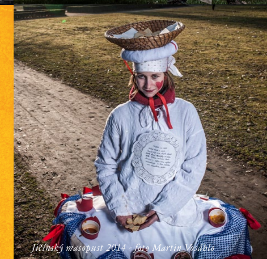
Jičínský masopust 2014