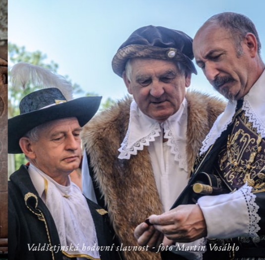
Valdštejnská hodovní slavnost