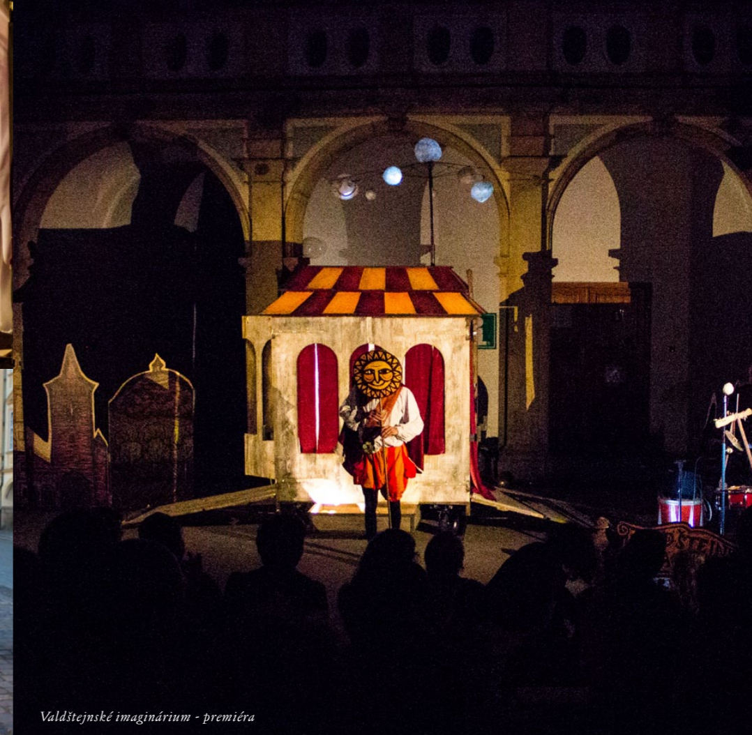
Valdštejnské imaginárium - premiéra