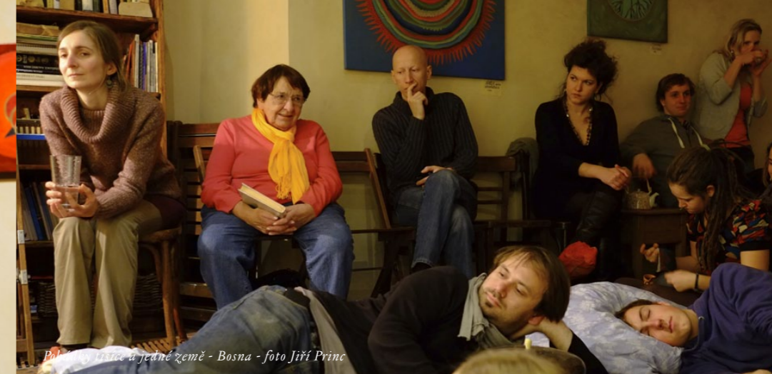
Pohádky tisíce a jedné země - Bosna