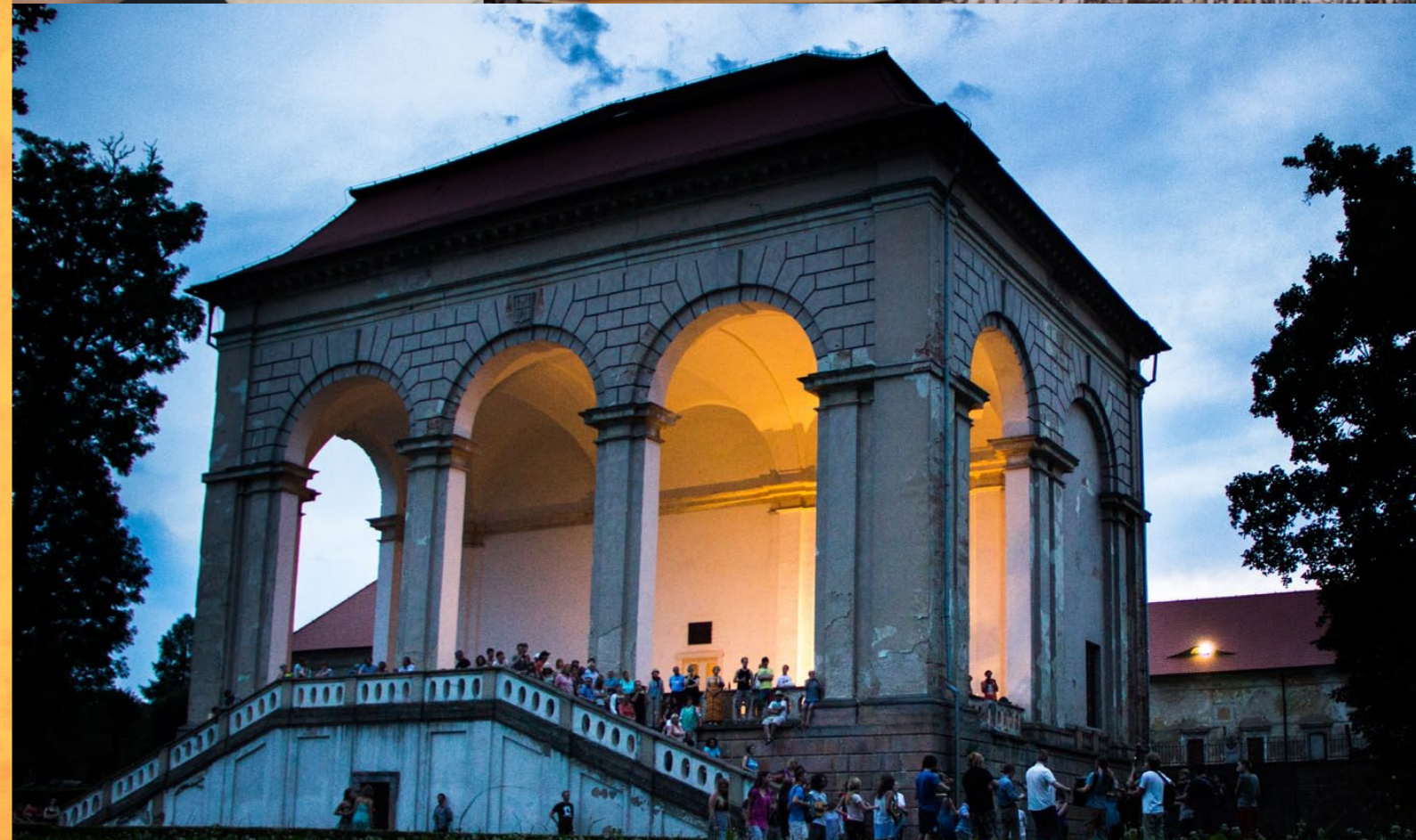
Etno Histeria Umeuropa Caravan