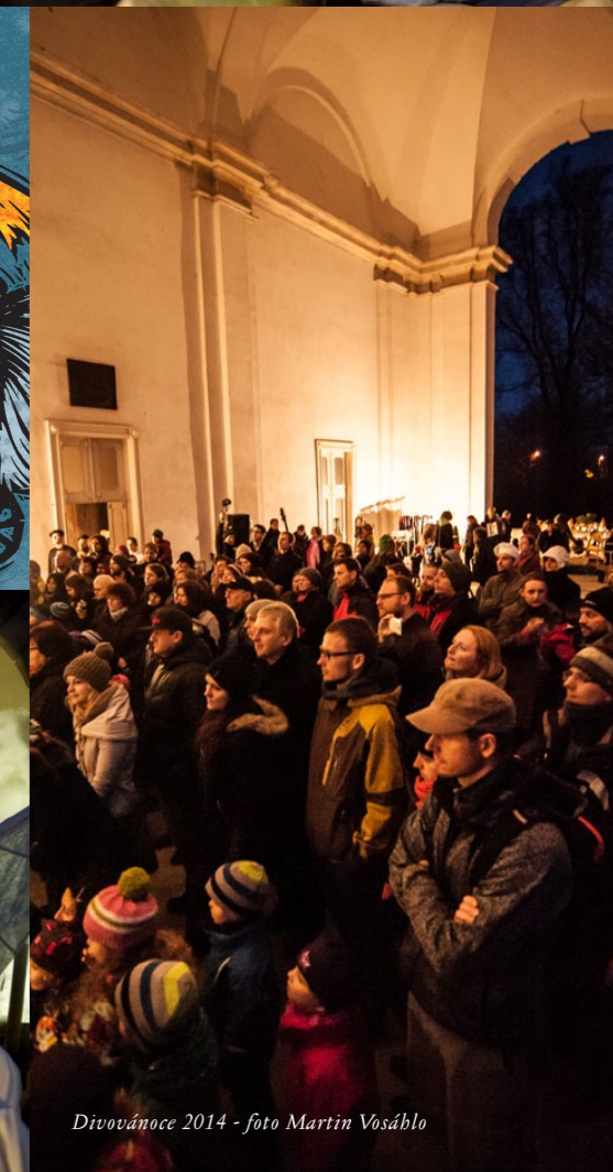
Divovánoce 2014