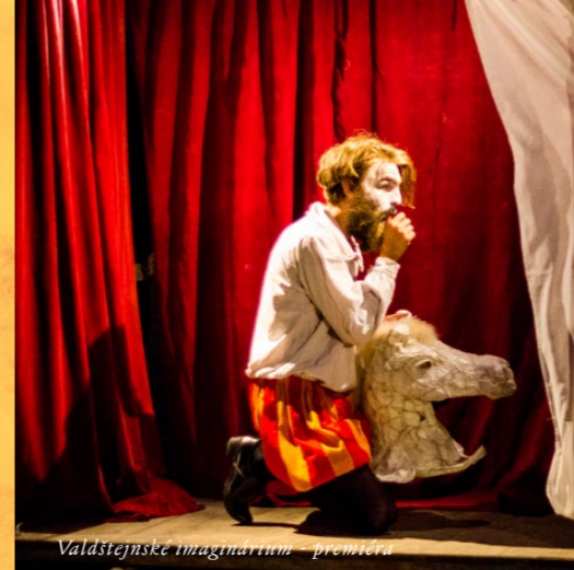
Valdštejnské imaginárium - premiéra