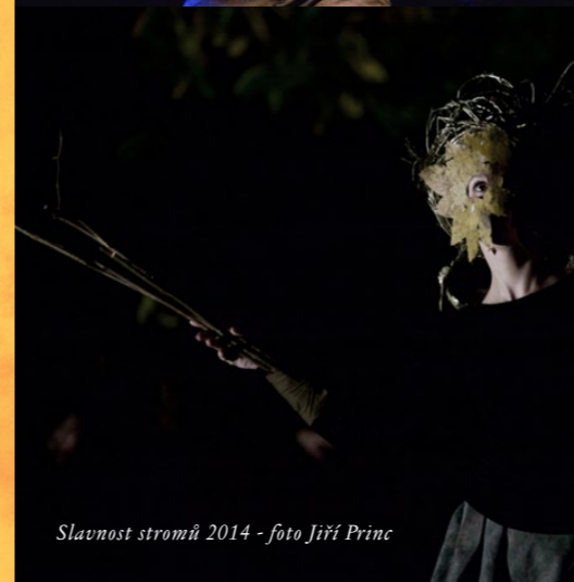
Slavnost stromů 2014