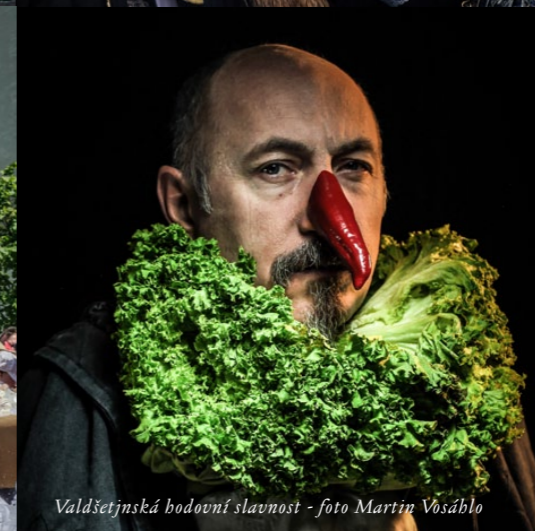
Valdštejnská hodovní slavnost