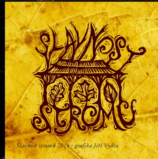
Slavnost stromů 2014 - grafika Jiří Vydra