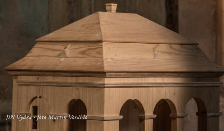
Jiří Vydra

Valdštejnská lodžie - kulturní imaginárium