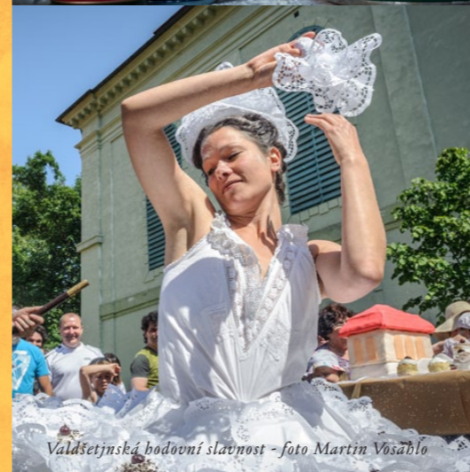
Valdštejnská hodovní slavnost