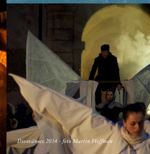
Divovánoce 2014