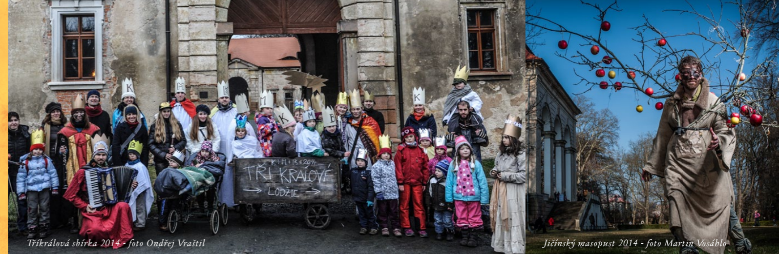
Tříkrálová sbírka 2014