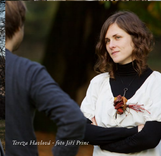
Tereza Havlová