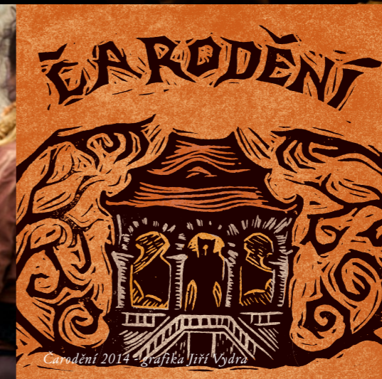
Čarodění 2014 - grafika Jiří Vydra