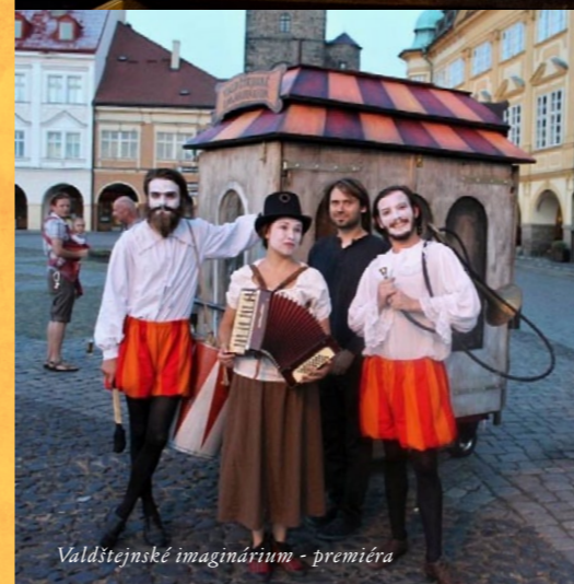
Valdštejnské imaginárium - premiéra