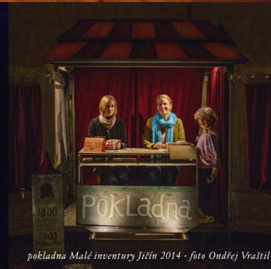
pokladna Malé inventury Jičín 2014