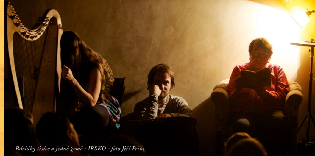
Pohádky tisíce a jedné země - IRSKO