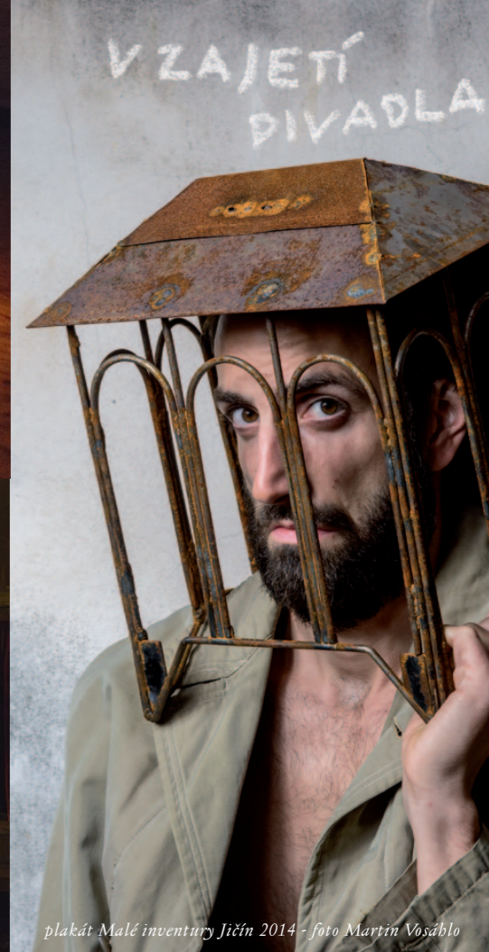
plakát Malé inventury Jičín 2014