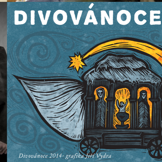
Divovánoce 2014 - grafika Jiří Vydra