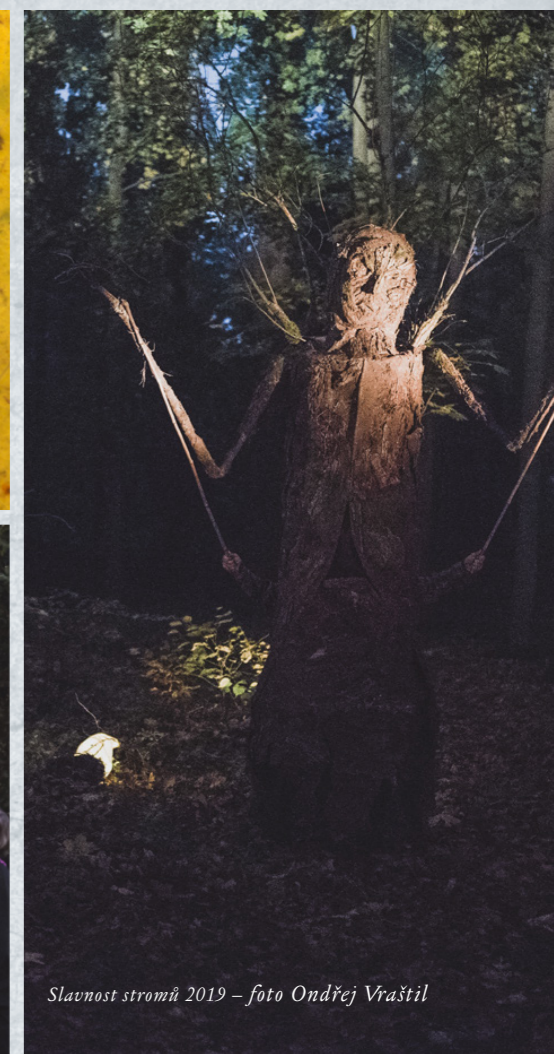
Slavnost stromů 2019