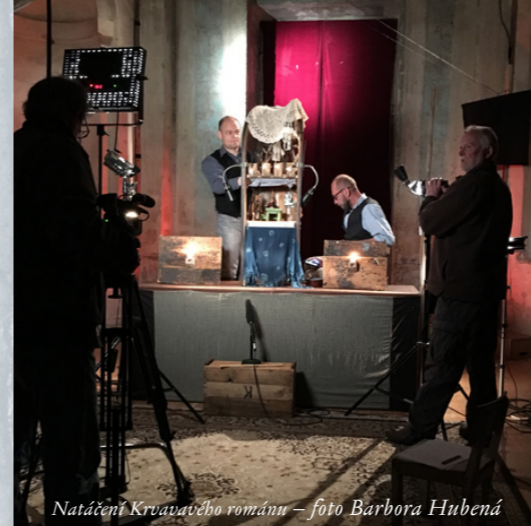
Natáčení Krvavého románu – foto Barbora Hubená