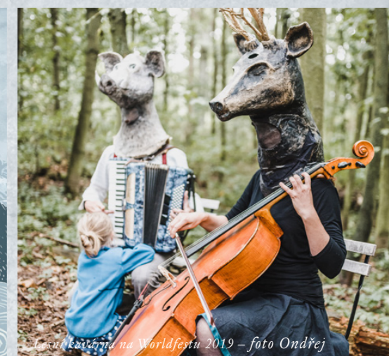
Lesní kavárna na Worldfestu 2019