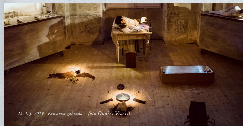
M. I. J. 2019 – Faustova zahrada – foto Ondřej Vraštil