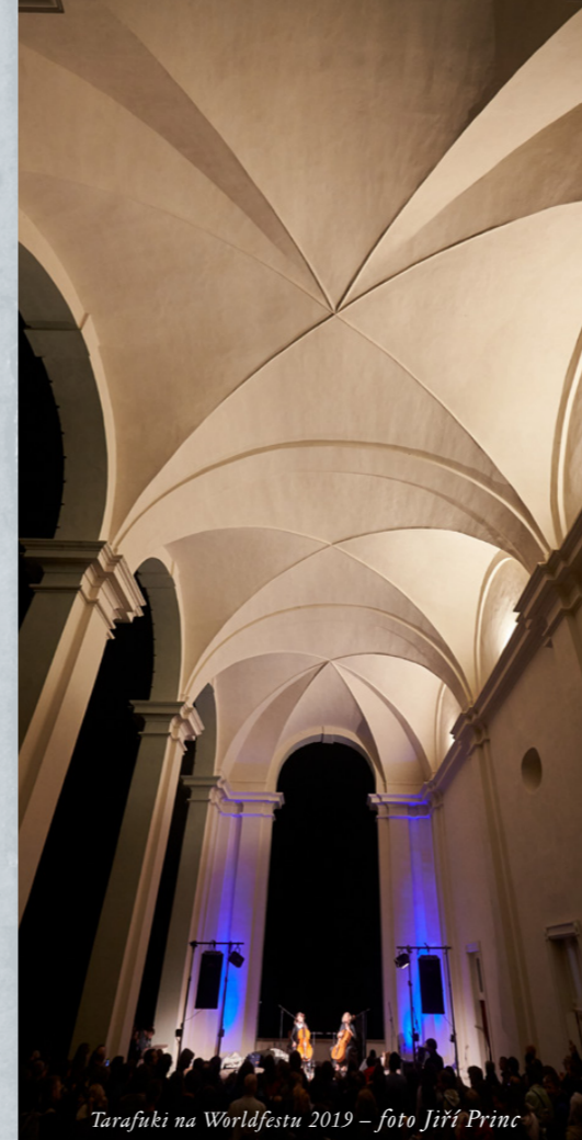
Tarafuki na Worldfestu 2019