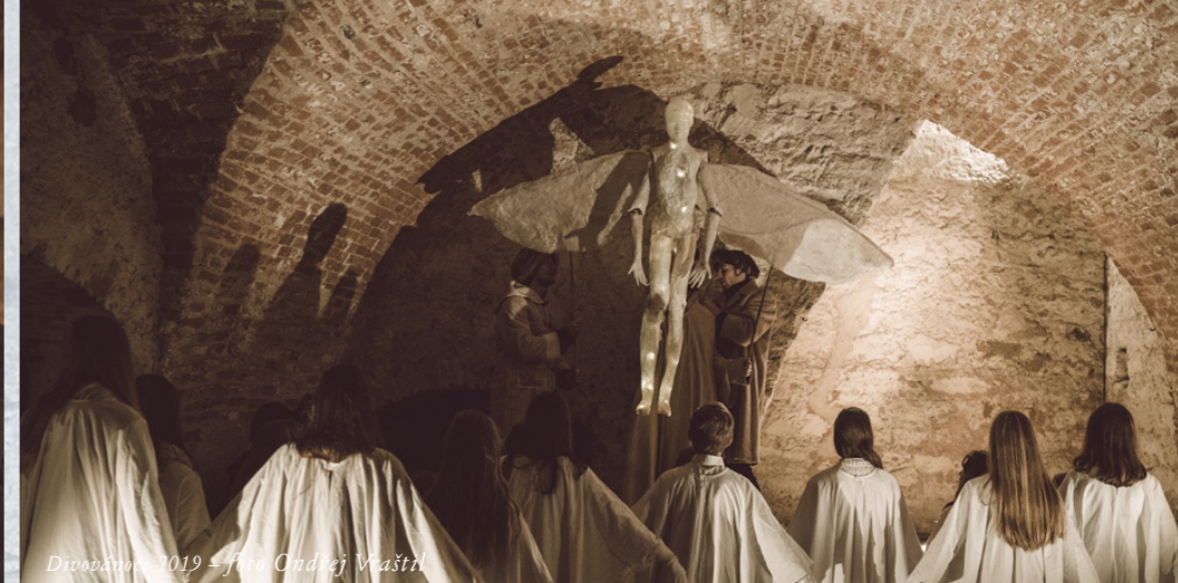
Divovánoce 2019