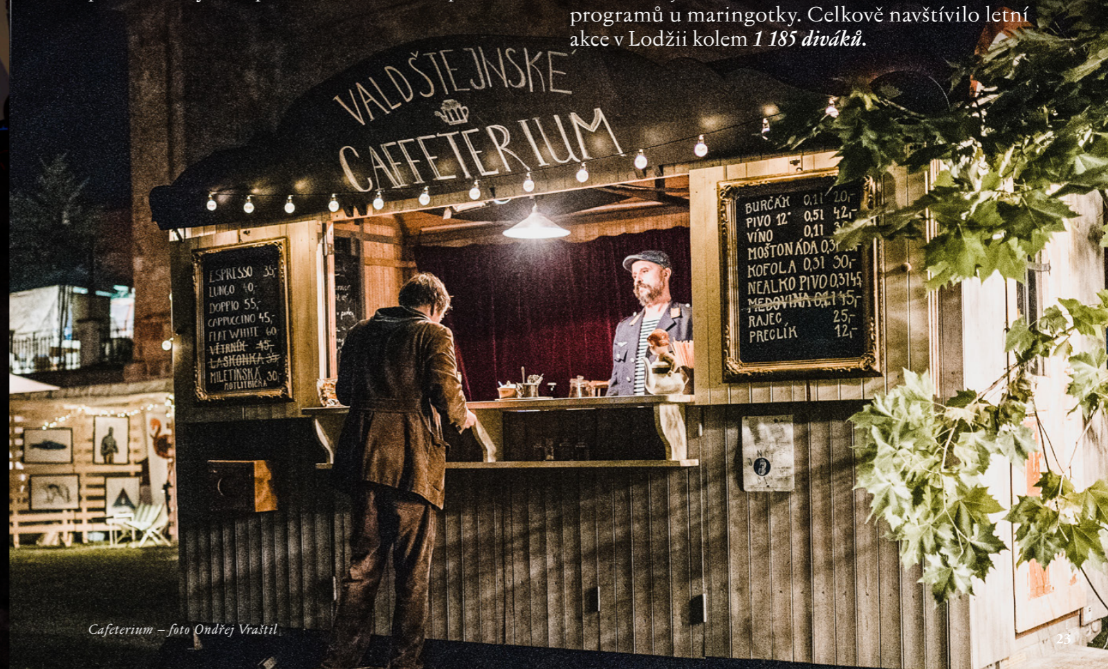
Cafeterium