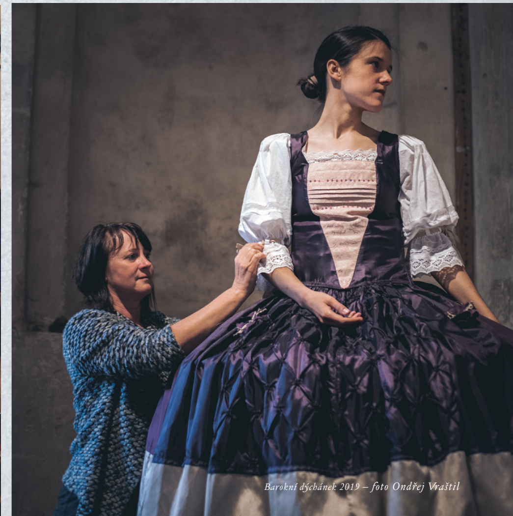
Barokní dýchánek 2019