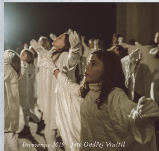
Divovánoce 2019