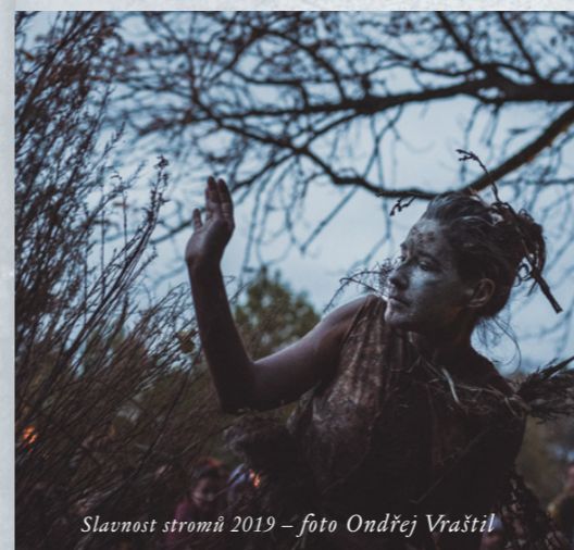
Slavnost stromů 2019