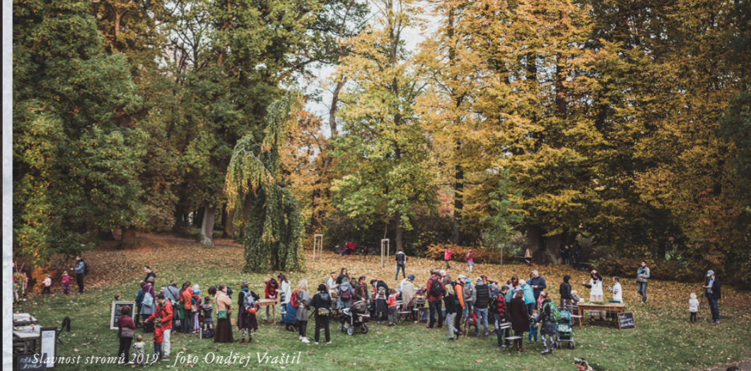
Slavnost stromů 2019