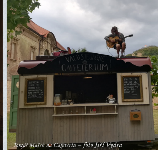
Tomáš Mašek na Cafeteriu