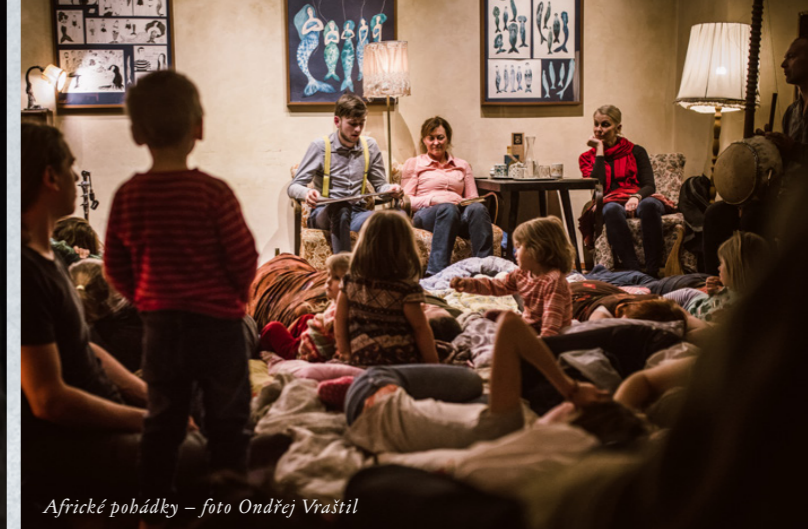
Africké pohádky