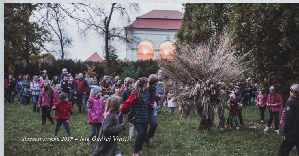
Slavnost stromů 2019