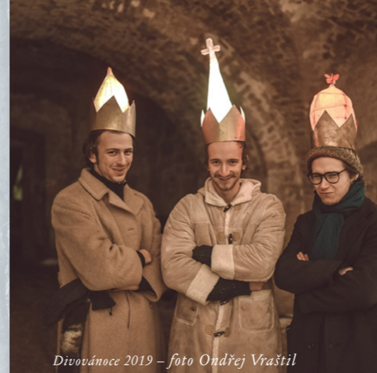
Divovánoce 2019

Koncerty ..... 30 Jiné (Poesion, Cafeterium, atd.) ..... 25 Divadlo ..... 9 Rezidence ..... 8 Velké akce ..... 6