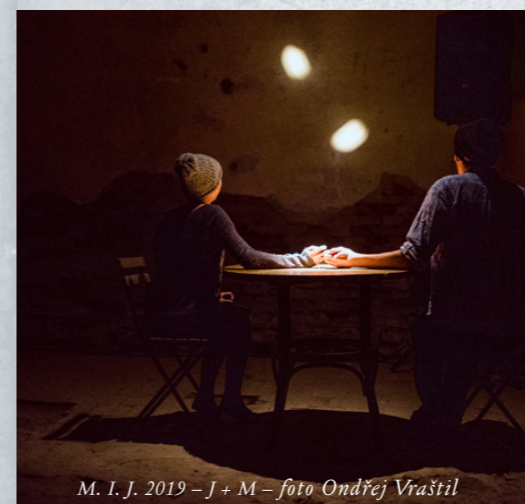
M. I. J. 2019 – J + M