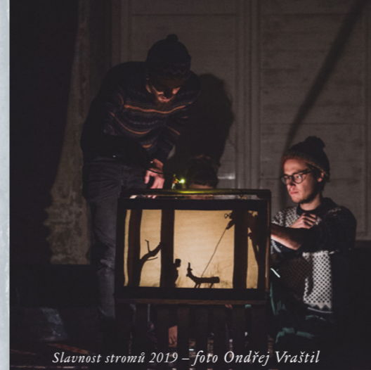
Slavnost stromů 2019