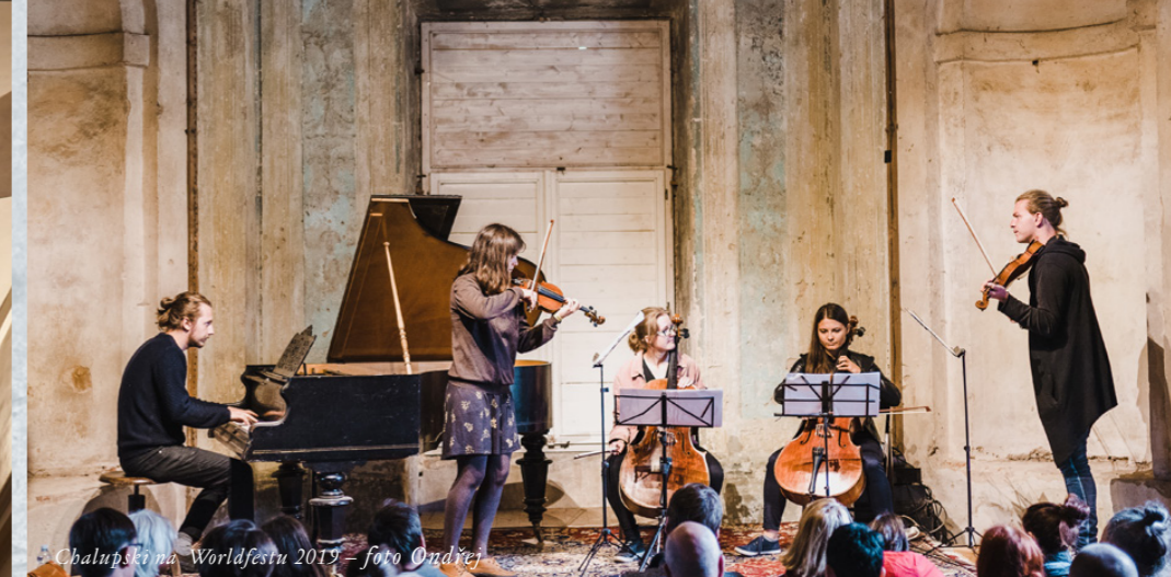
Chalupští na Worldfestu 2019