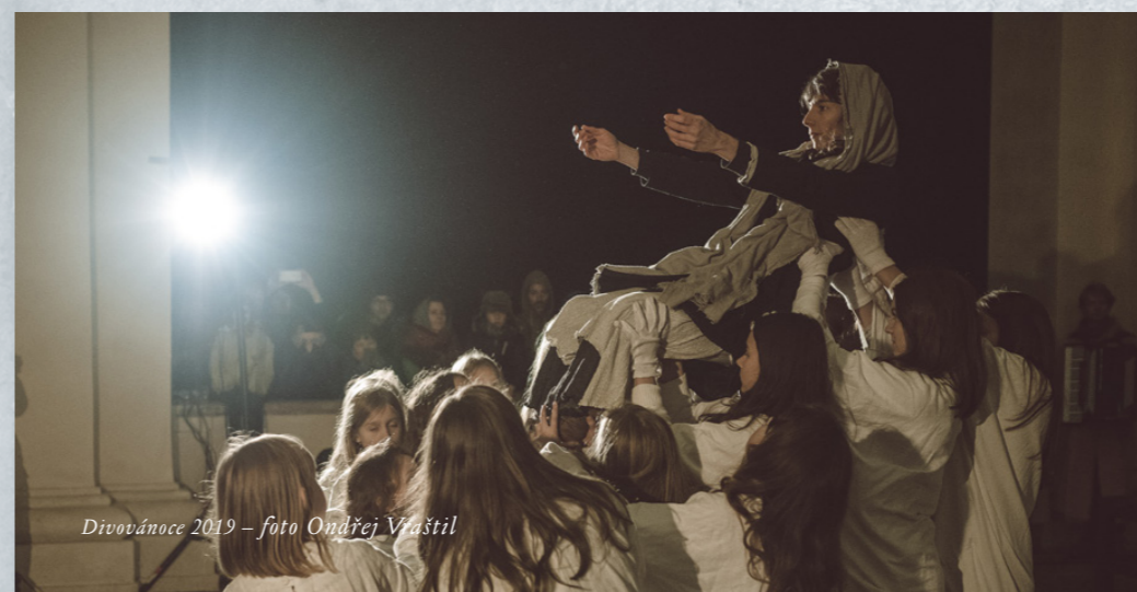
Divovánoce 2019