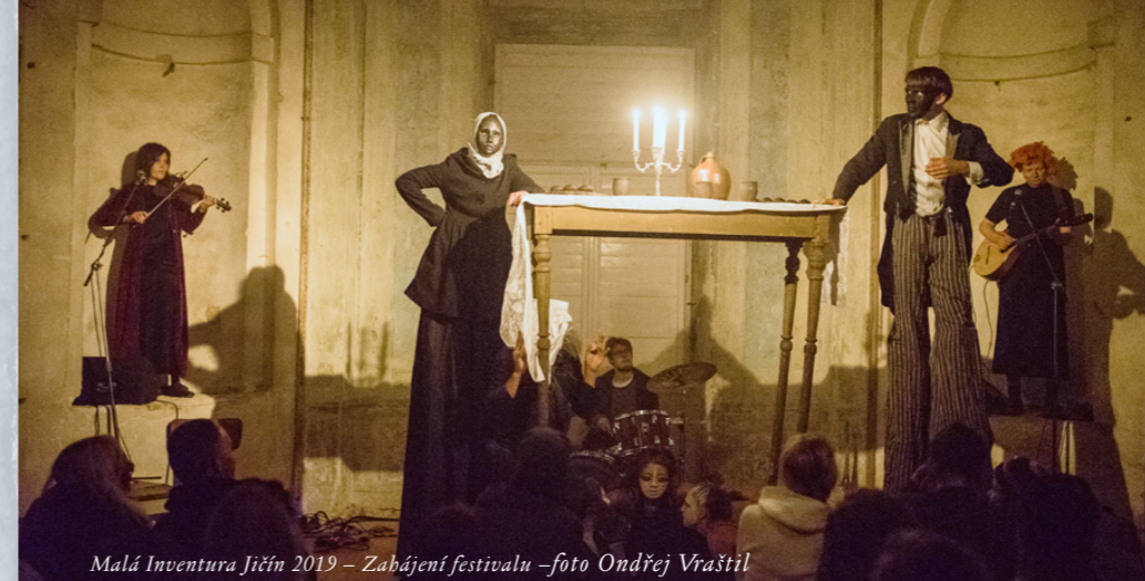
Malá Inventura Jičín 2019 – Zahájení festivalu