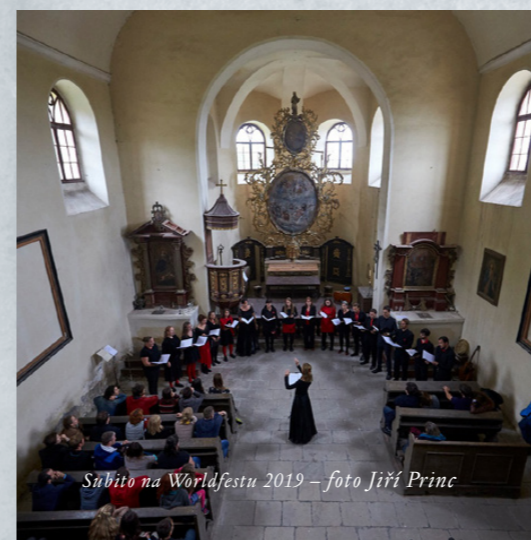
Subito na Worldfestu 2019