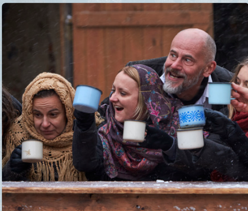
Divovánoce 2017