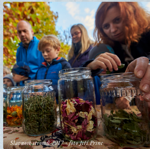
Slavnost stromů 2017