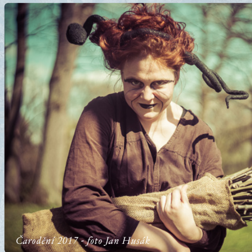
Čarodění 2017