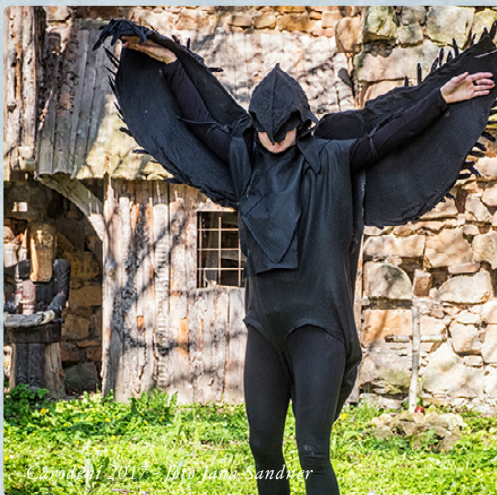
Čarodění 2017