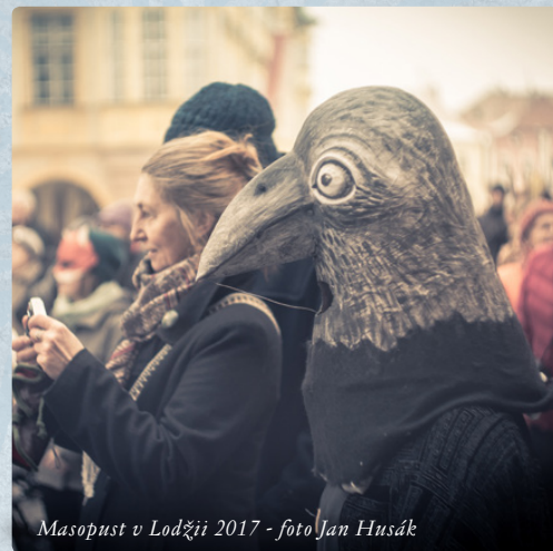
Masopust v Lodžii 2017