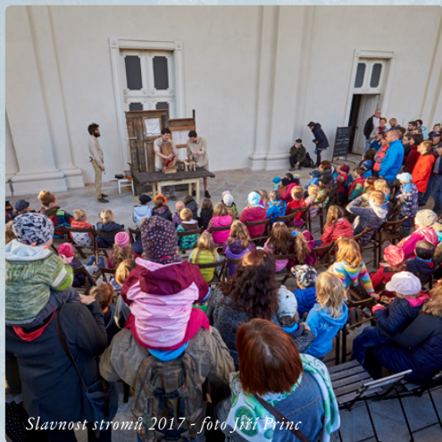
Slavnost stromů 2017