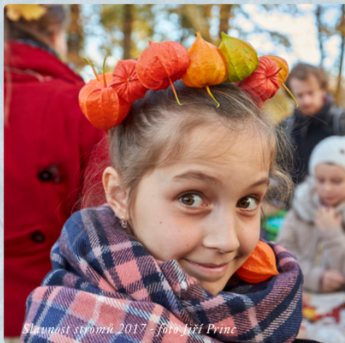
Slavnost stromů 2017 - foto Jiří Princ