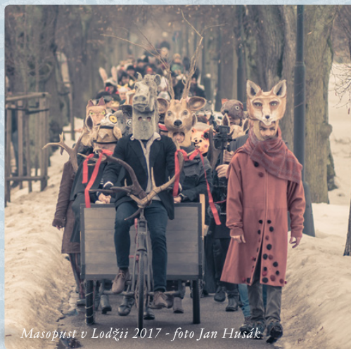
Masopust v Lodžii 2017 - foto Jan Husák