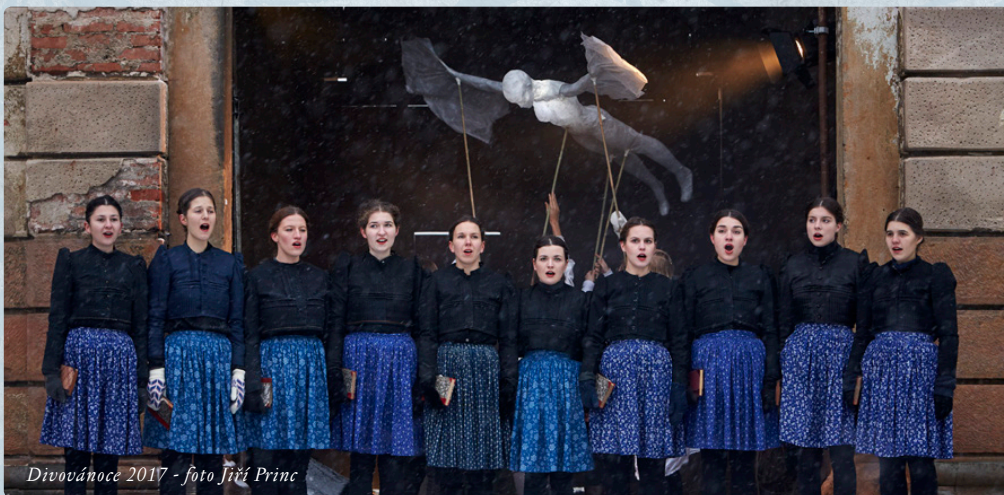
Divovánoce 2017