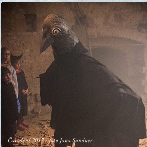
Čarodění 2017