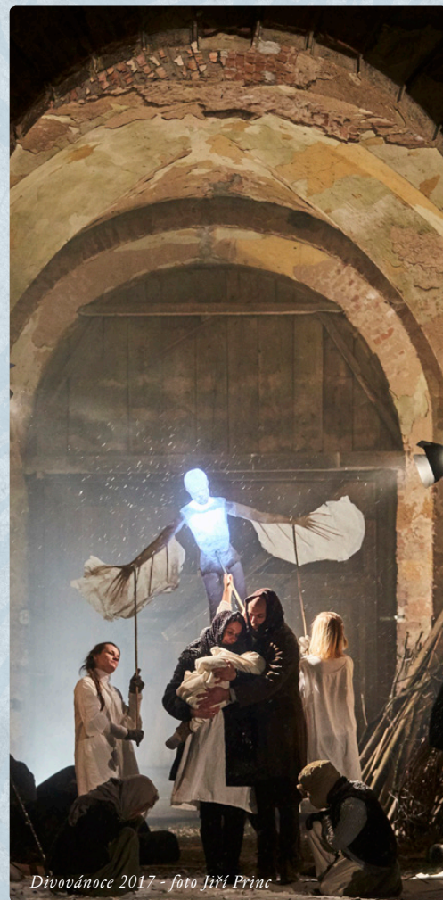
Divovánoce 2017