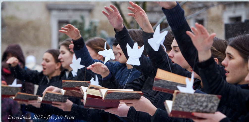
Divovánoce 2017