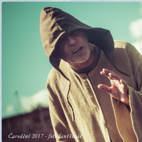
Čarodění 2017