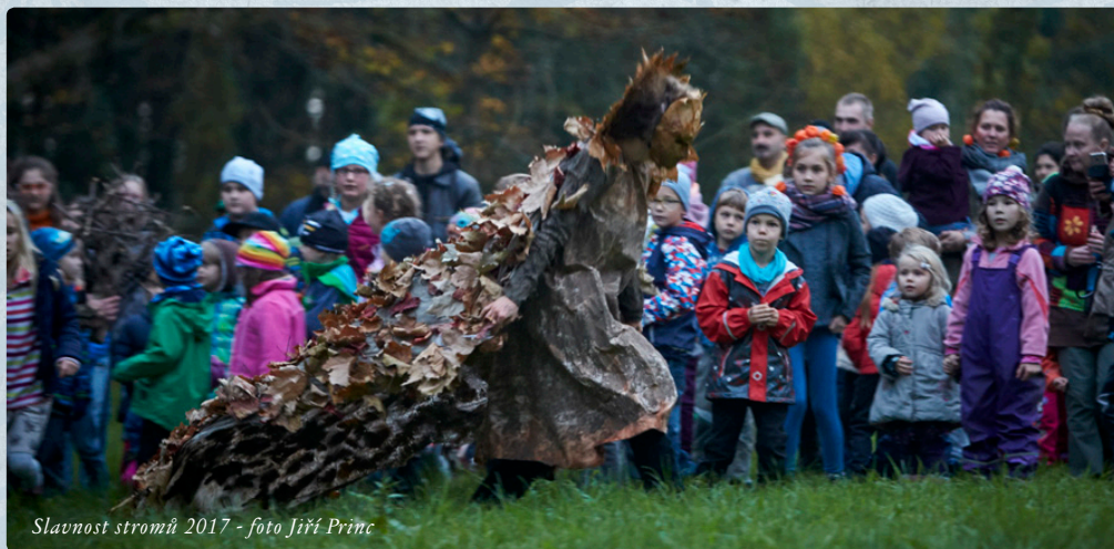
Slavnost stromů 2017