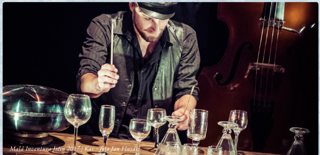
Malá Inventura Jičín 2017 | Kar