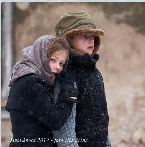
Divovánoce 2017