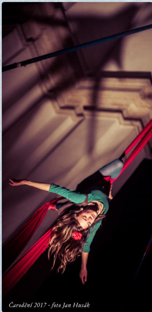
Čarodění 2017 - foto Jan Husák