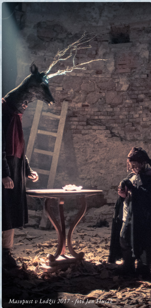
Masopust v Lodžii 2017