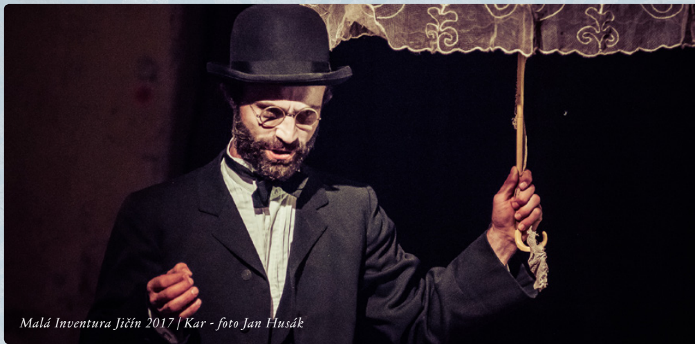
Malá Inventura Jičín 2017 | Kar