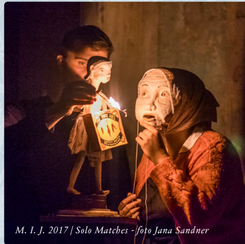
M. I. J. 2017 | Solo Matches