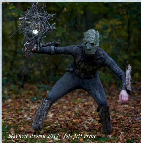
Slavnost stromů 2017