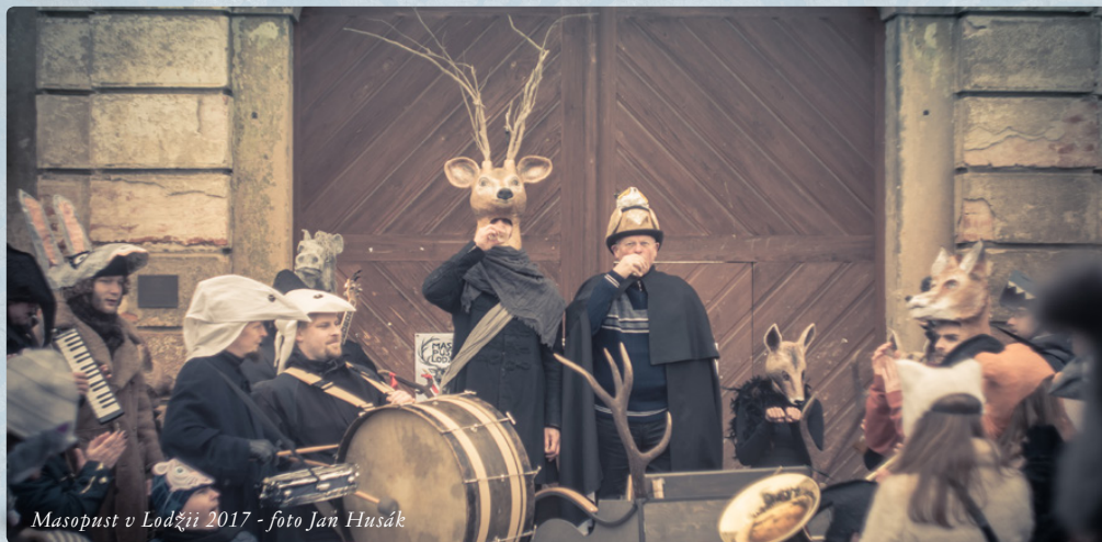
Masopust v Lodžii 2017