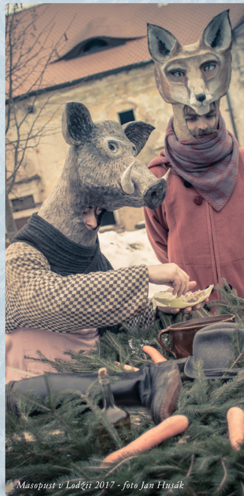
Masopust v Lodžii 2017