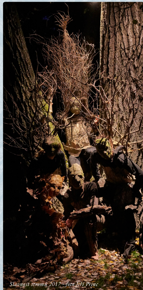
Slavnost stromů 2017