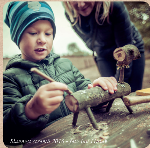
Slavnost stromů 2016