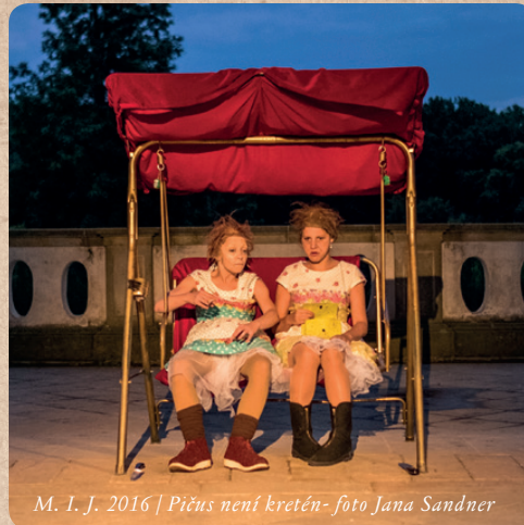
M. I. J. 2016 | Pišus není kretěn