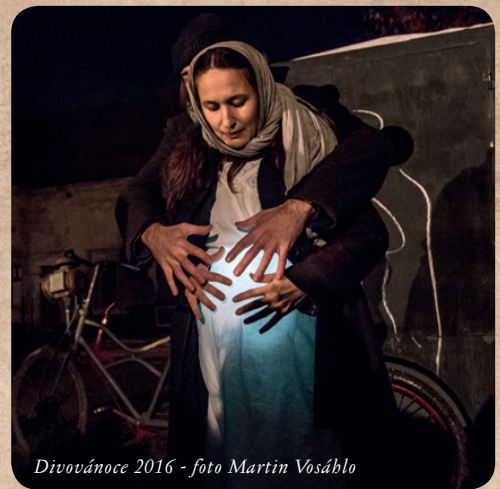
Divovánoce 2016