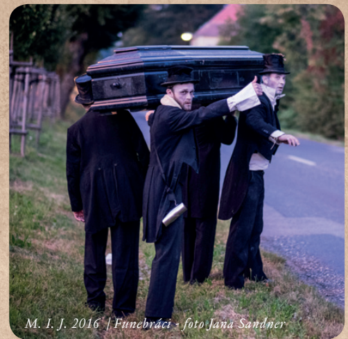
M. I. J. 2016 | Funebráci