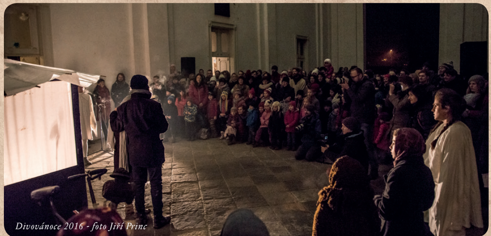
Divovánoce 2016