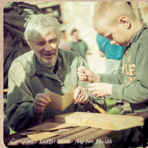
Čarodění v Lodžii 2016