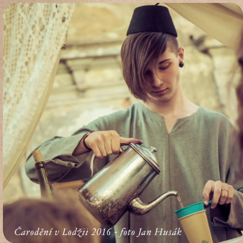
Čarodění v Lodžii 2016