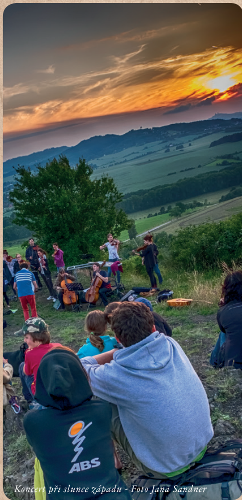
Koncert při slunce západu