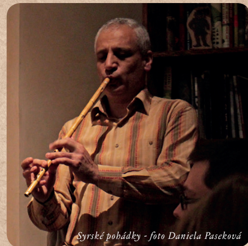
Syrské pohádky