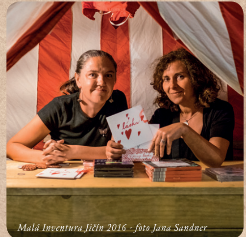
Malá Inventura Jičín 2016