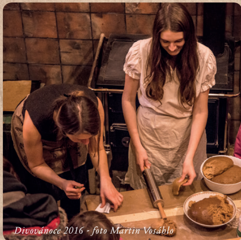
Divovánoce 2016