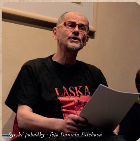
Syrské pohádky