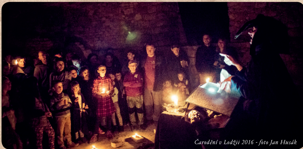
Čarodění v Lodžii 2016