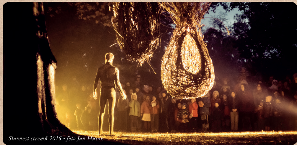
Slavnost stromů 2016