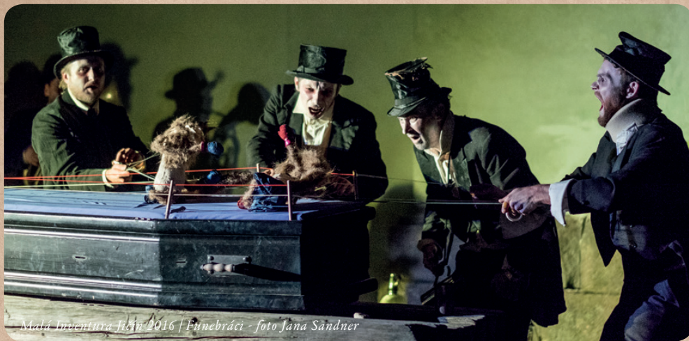
Malá Inventura Jičín 2016 | Funebráci