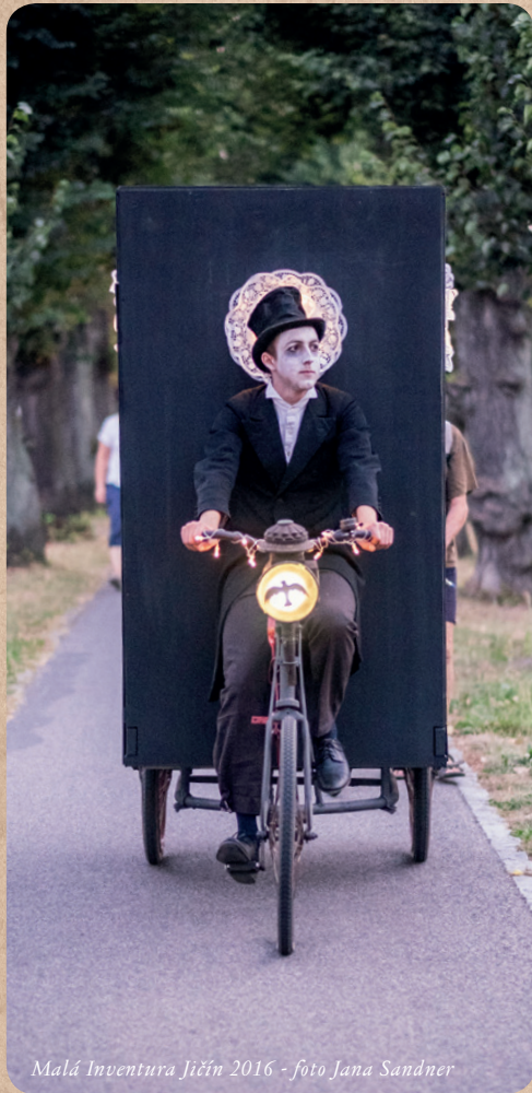
Malá Inventura Jičín 2016