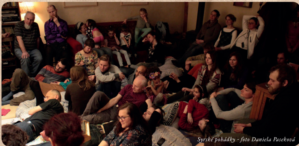
Syrské pohádky