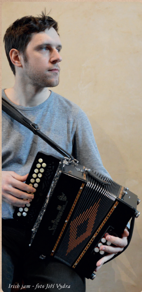
Irish jam