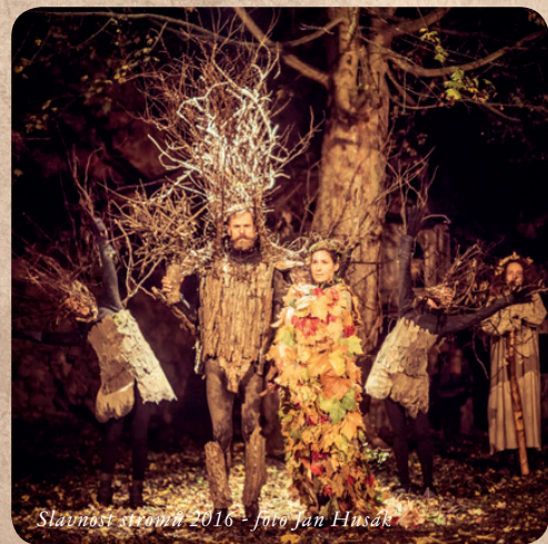
Slavnost stromů 2016