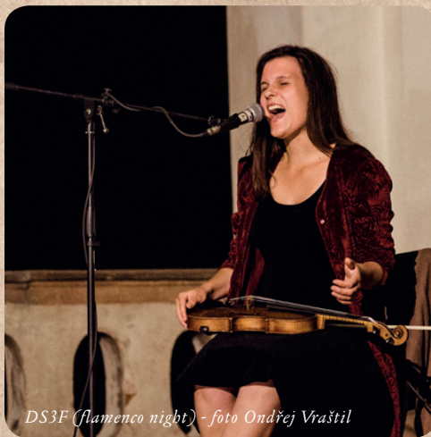
DS3F (flamenco night)