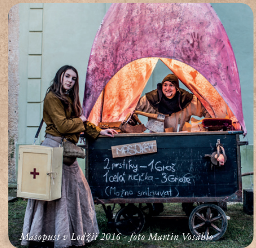
Masopust v Lodžii 2016