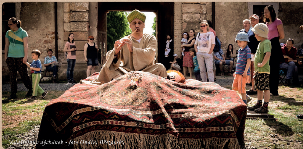
Valdštejnův dýcbánek