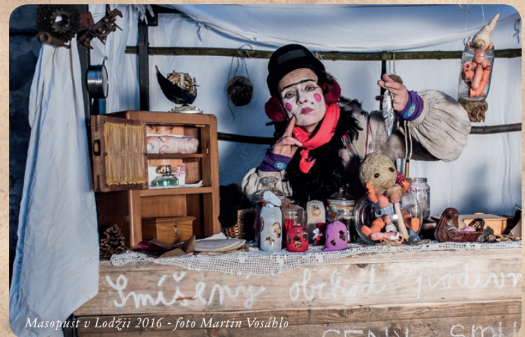
Masopust v Lodžii 2016