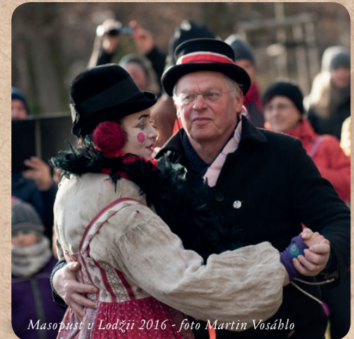
Masopust v Lodžii 2016