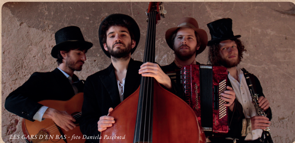
LES GARS D'EN BAS