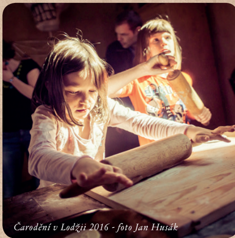
Čarodění v Lodžii 2016