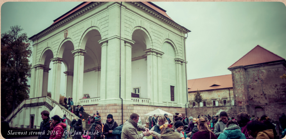
Slavnost stromů 2016