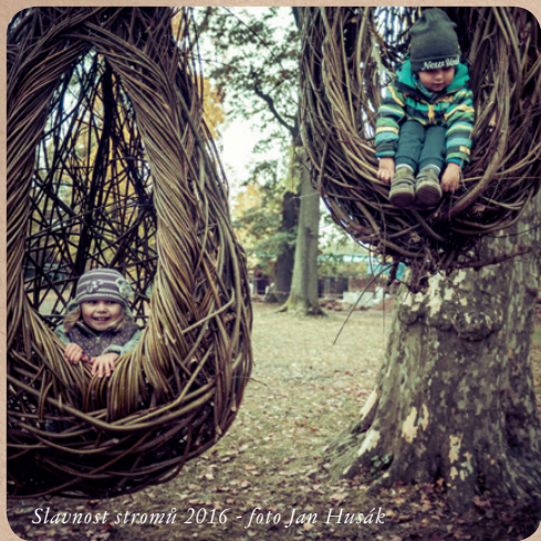
Slavnost stromů 2016