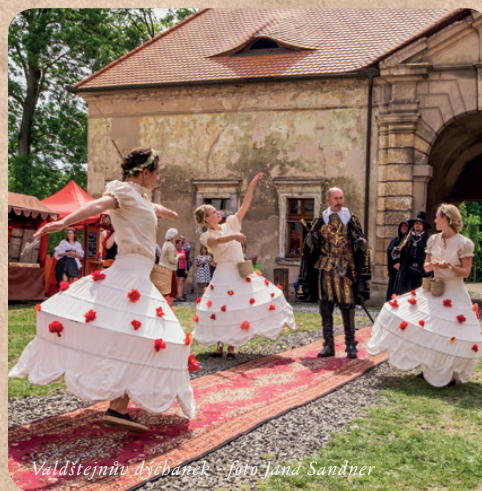
Valdštejnův dýcbánek