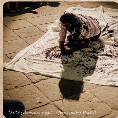
DS3F (flamenco night)