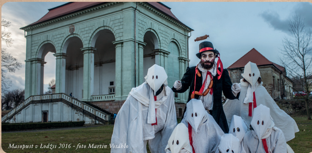
Masopust v Lodžii 2016