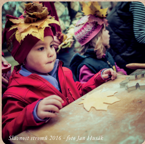
Slavnost stromů 2016 - foto Jan Husák