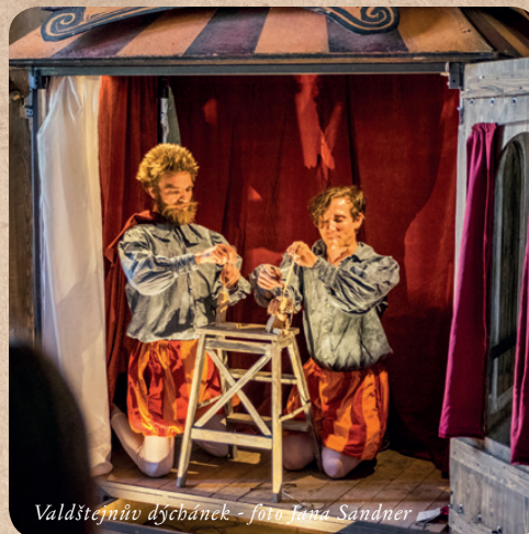
Valdštejnův dýcbánek