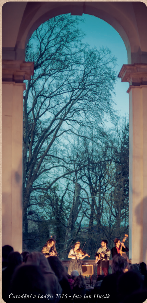
Čarodění v Lodžii 2016