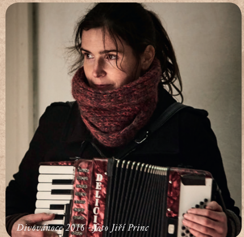
Divovánoce 2016