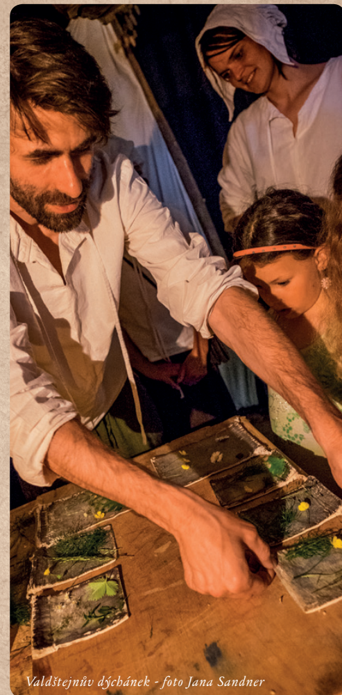
Valdštejnův dýcbánek