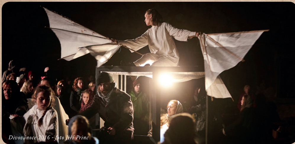
Divovánoce 2016