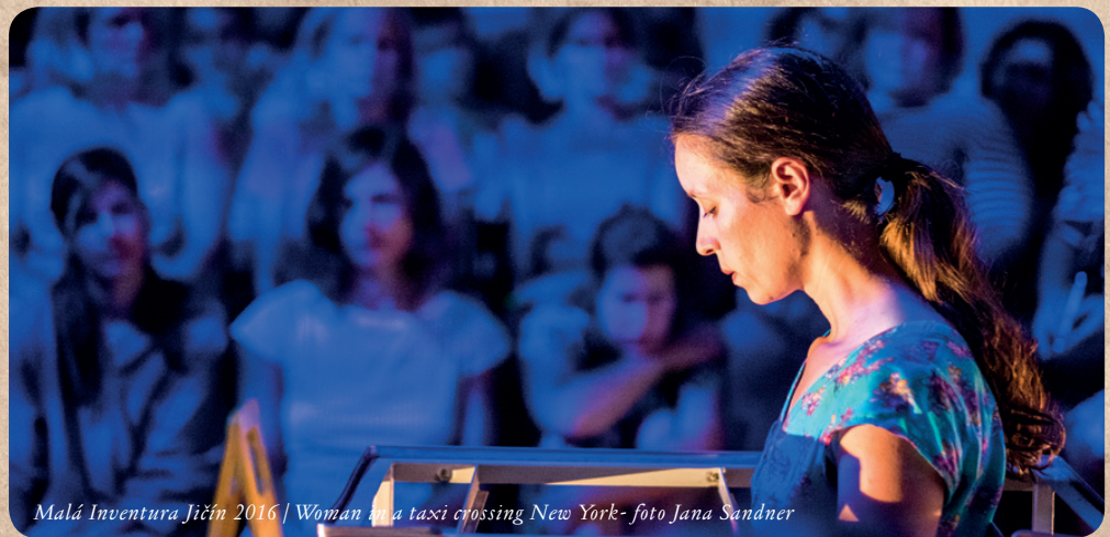
Malá Inventura Jičín 2016 | Woman in a taxi crossing New York