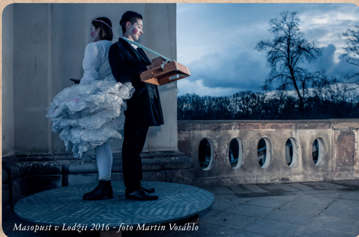
Masopust v Lodžii 2016