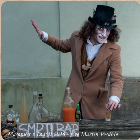
Masopust v Lodžii 2016