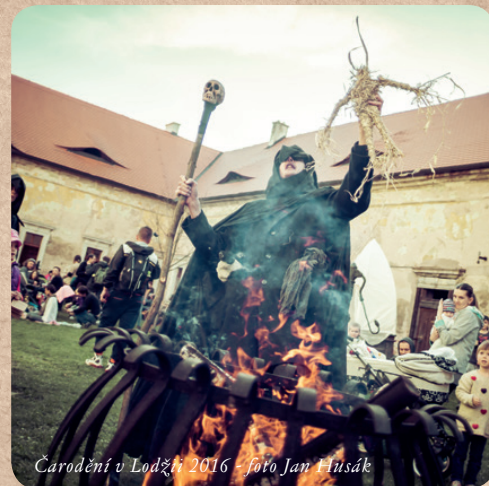
Čarodění v Lodžii 2016